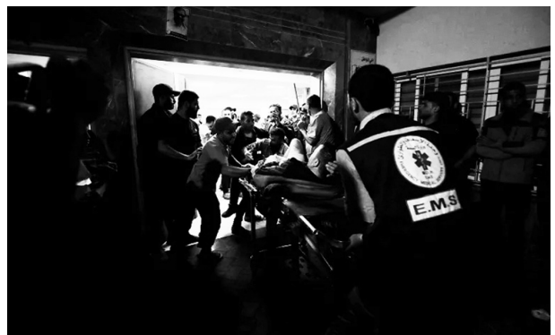
■先月のアハリー・アラブ病院での爆発で負傷した数百人のパレスチナ人は、アル・シファ病院に移された。現在、アル・シファはイスラエル軍の砲撃の標的となっている

またここで重要な点は、言われるようにハマースが「原理主義」で「イスラエル国家の廃絶」を主張しているということでは全くない、ということだ。そもそも原理主義というレッテル自体が欧