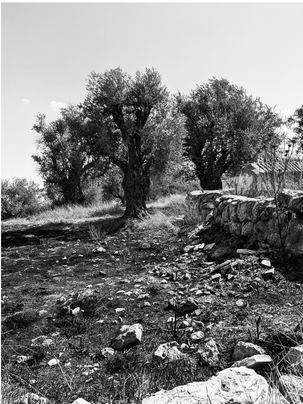
■焼かれてしまったリーブの木