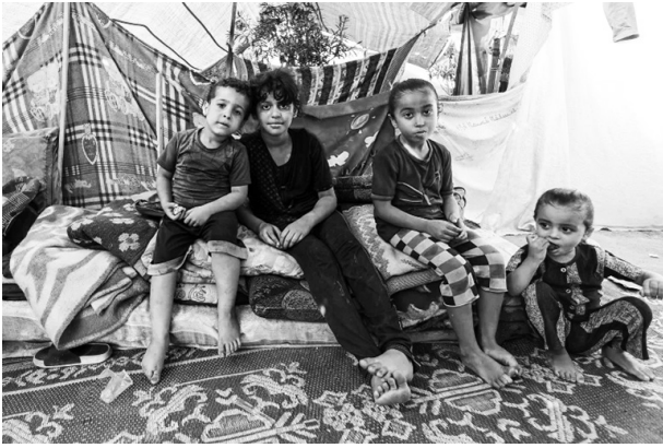
■ガザ市のシファ病院には少なくとも5,000人の患者と数千人の難民が収容されている

りの自治で、事実上は東エルサレムも入植地の土地も国境管理も水資源も奪われたままの欺瞞的な「和平」にパレスチナ人の我慢の限界が来て、第二次インティファダが勃発。これによりイスラエルは本格的な「切り離し」を始めるのだが、狭隘で資源的価値の小さいガザ地区は全体として切り離し（2005年にガザ地区内の入植地と軍基地を撤去したこともその一段階）、入植地・農地・聖地・水源などの資源的価値の大きい西岸地区は細分化したうえで入植地を領土化しつつパレスチナ人の街を切り離すことに（隔離壁はその一手段）。つまりパレスチナ自治政府との政治交渉を抜きに占領政策の一方向的な転換を図ったのだ。