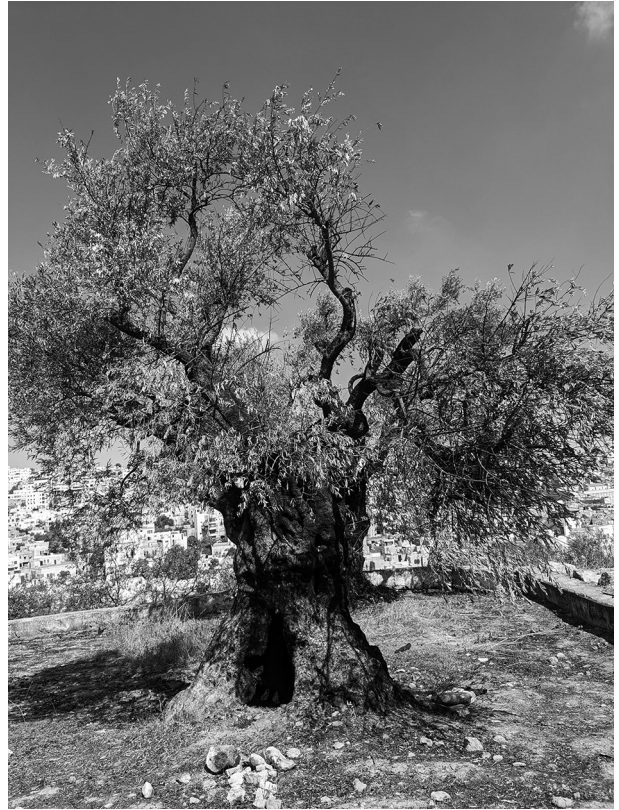
■焼かれてしまったリーブの木

研修に行かれた女性の研修者であった。女子学生が多く、生き生きと学んでいた。石鹼工場を経営する方（ケンブリッジ大学で建築学を学ばれた）が商店を案内くださり甘い甘い御菓子をご馳走して下さった。ゲリジム山からエバル山を眺める。