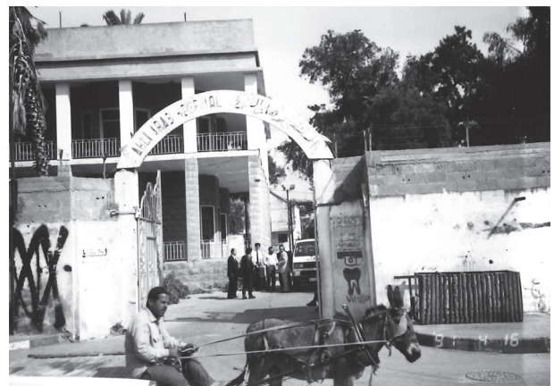
■アハリー・アラブ病院

アハリー・アラブ病院は、1893年英国教会宣教会（CMS）により設立されたパレスチナにおける最古の病院です。1980年初頭以降は、現地の聖公会エルサレム教区が同病院の運営に当たってきました。同時期1982年レバノン戦争が勃発し、サブラ、シャティーラ・パレスチナ難民キャンプ大虐殺が起きたことは銘記さるべき事件です。虐殺された難民が、さらに虐殺されて難民として避